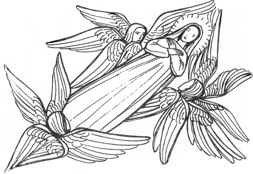
L'Assomption : Marie monte avec son corps et son âme dans le ciel.