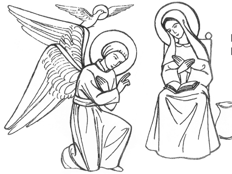
L'Annonciation : Marie dit «Oui». Elle sera la maman de Jésus.