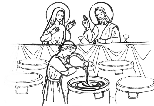
Les Noces de Cana. Marie demande à Jésus de l'aide.