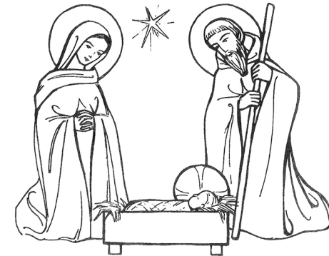
La Nativité de Jésus.