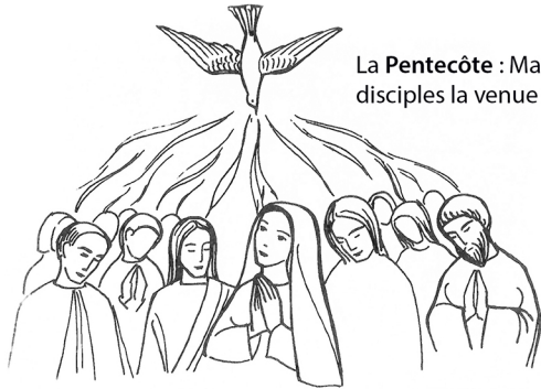
La Pentecôte : Marie prie avec les disciples la venue de l'Esprit Saint.