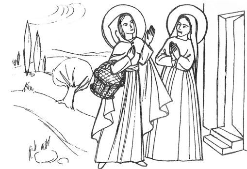
La Visitation de Marie à sa Cousine Elisabeth.